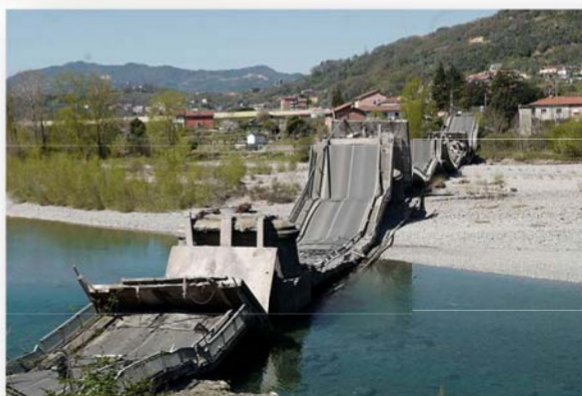
Puente sobre el Río Magra